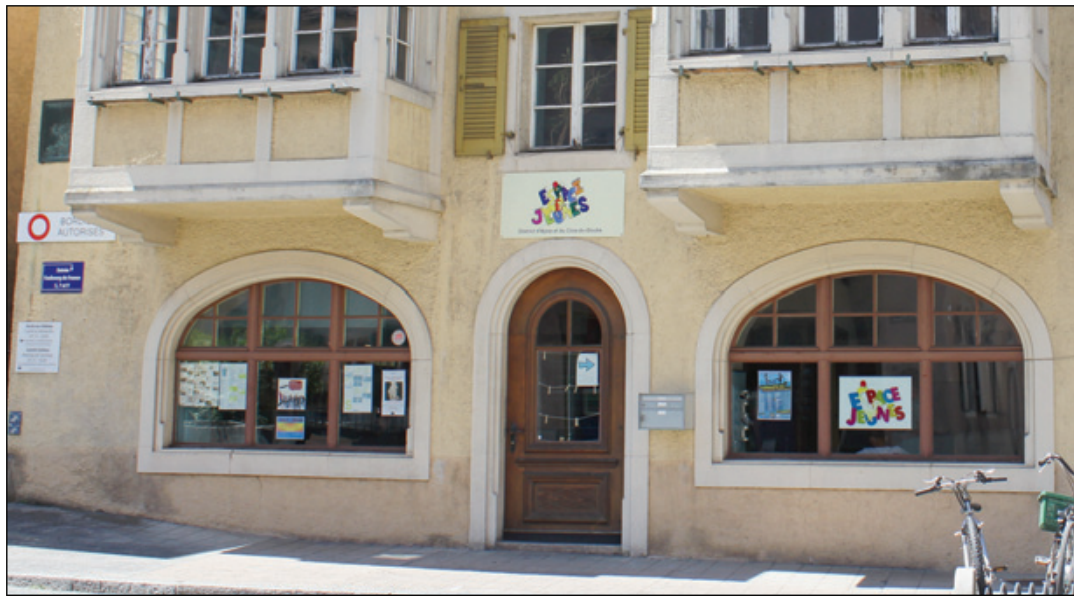
L'Espace-Jeunes de Porrentruy fête ses dix ans avec la population.

Une journée officielle d'anniversaire de l'Espace-Jeunes de Porrentruy est planifiée le samedi 2 septembre prochain. Mais auparavant, un gâteau géant a été installé devant Esplanade Centre le 7 juin dernier et il y restera jusqu'à fin août. Conçu par l'équipe de la voirie, puis décoré par les jeunes de l'Espace-Jeunes avec l'aide des animateurs, cette pièce monumentale aura pour objectif d'informer les passants de l'anniversaire célébré par l'Espace-Jeunes, mais aussi de donner envie aux jeunes qui ne fréquenteraient pas encore l'endroit de venir voir ce qu'il s'y passe. Une première animation, mise sur pied par les jeunes et les animateurs, a eu lieu le 7 juin, intitulée «Gâteau musical», inspirée du jeu «Les chaises musicales». Durant le mois de juin, encore deux animations sont au pro-