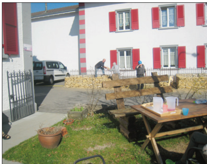
Un cadre convivial et chaleureux à découvrir le 1 er juillet à Cornol.

Après le défilé de mode du mois d'avril, la journée officielle aura lieu le samedi 1 er juillet. La première partie de cette journée, ouverte au public, commencera à 10h30 au centre de jour par quelques discours officiels suivis d'un apéritif, de la visite de l'établissement et de la découverte du jardin surélevé réalisé avec des pierres sèches des Franches-Montagnes, grâce au don du Rotary Club Les Rangiers. La suite des festivités sera spéciale-