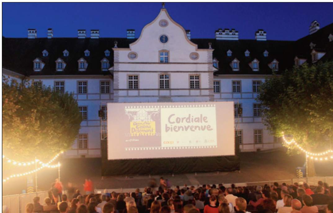
Encore des soirées pleines d'émotions !

La vingtième édition de l'Open Air Cinéma a commencé le vendredi 3 août dernier et a déjà comblé le public présent. Une météo idéale a présidé aux projections de «Tout le monde debout», «Les indestructibles 2» ou encore le dernier volet de Jurassic World, «Fallen Kingdom». La suite du programme, qui s'étendra jusqu'au 25 août, ne manquera pas de satisfaire tous les goûts et tous les publics. Quelques films sont très attendus notamment «La Finale» avec Thierry Lhermite (samedi 11 août), «Ferdinand» (vendredi 17 août), ou encore «Deadpool 2» (samedi 18 août), «3 Billboards, Les panneaux de la vengeance» (mardi 21 août), «Ocean's 8» (jeudi 23 août), et «La Ch'tite Famille» (vendredi 24 août).