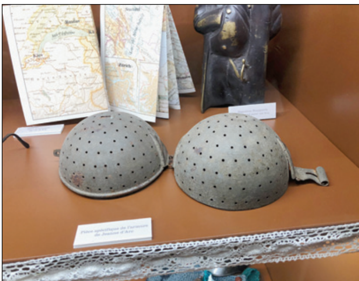
Des objets rares et authentiques à voir au «Pire», comme cette pièce spécifique de l'armure de Jeanne d'Arc.