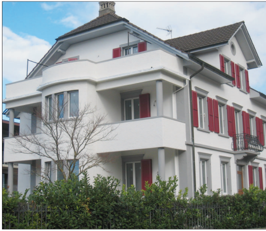
Une superbe bâtisse entièrement rénovée accueille maintenant les hôtes de la Valse du Temps.

L'ouverture de ce cinquième jour démontre que le besoin est réel dans la population jurassienne qui compte environ 1100 personnes atteintes de la maladie d'Alzheimer ou d'affection apparentée. Le centre de jour est tout autant bénéfique pour le proche aidant que pour la personne malade. En effet, durant cette journée, celle-ci pourra participer à des activités quotidiennes variées et adaptées à ses désirs et pos-